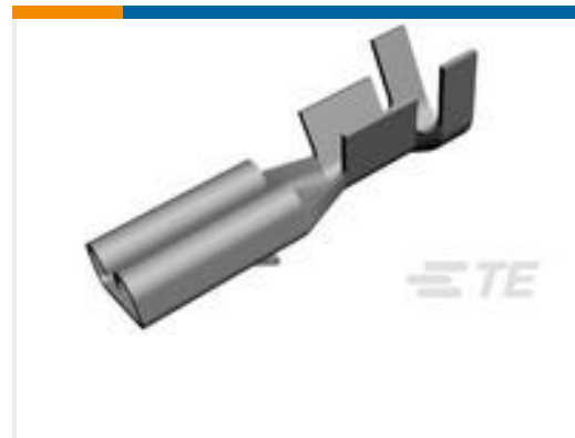
TE 产品编号160668-6 TERMINAL