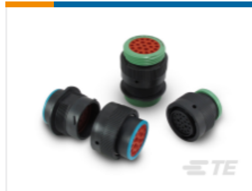
TE 产品编号YHDP26-24-35PEL017 DEUTSCH HDP20 壳体