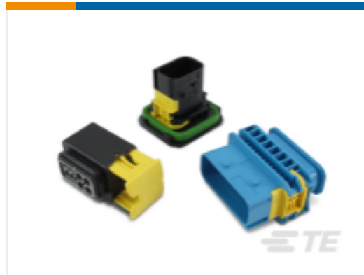
TE 产品编号2-1564532-1 重载密封连接器壳体