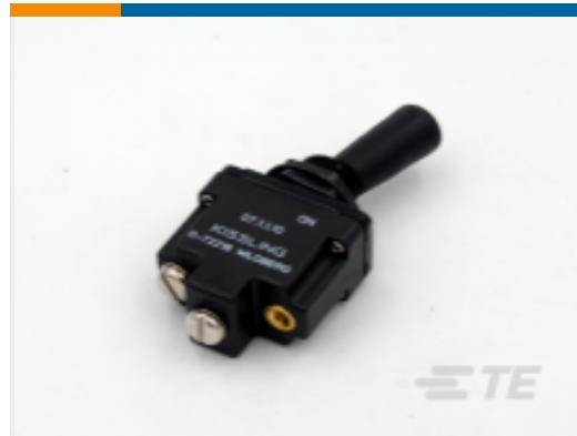
TE 产品编号K1007153 Toggle Switch 1-Pole, Sealed, Lever, Toggle, Plastic Lever