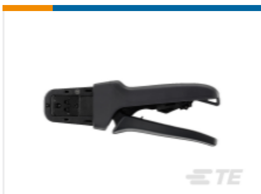
TE 产品编号DTT-20-03 CRIMP TOOL