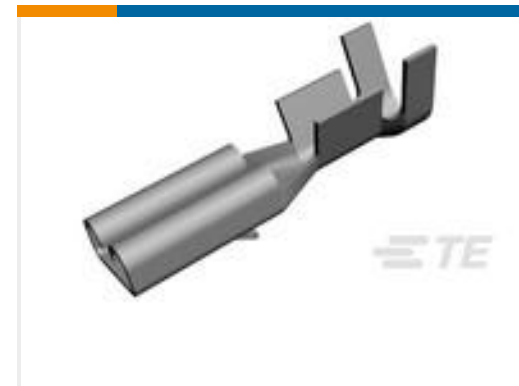
TE 产品编号160668-6 TERMINAL