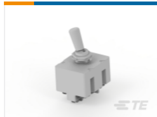
TE 产品编号K1002956 Toggle Switch 08-4-1-13