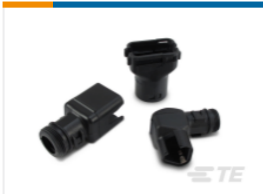
TE 产品编号1011-232-0305 DEUTSCH DT 后盖