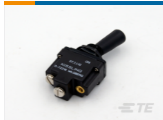
TE 产品编号K1007153 Toggle Switch 1-Pole, Sealed, Lever, Toggle, Plastic Lever