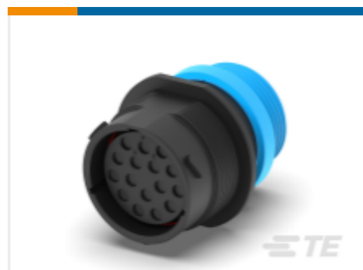
TE 产品编号HDP24-24-16SE-L015 REC, 16P, BLK, E, THD, 12, S