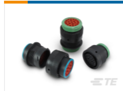
TE 产品编号YHDP26-24-35PEL017 DEUTSCH HDP20 壳体