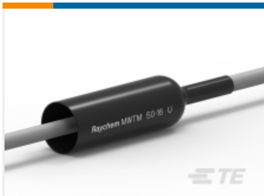
TE 产品编号834936-000 中厚壁热缩管