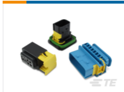
TE 产品编号2-1564532-1 重载密封连接器壳体