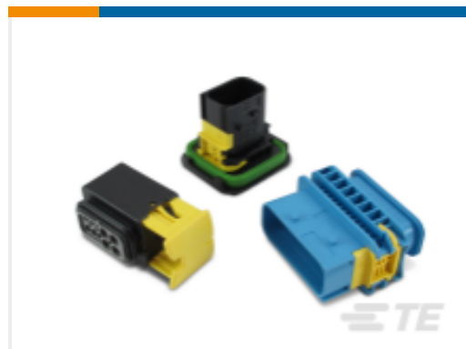
TE 产品编号1-1564416-1 重载密封连接器壳体