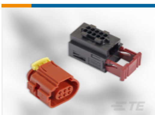
TE 产品编号1-929504-4 定时器，连接器壳体