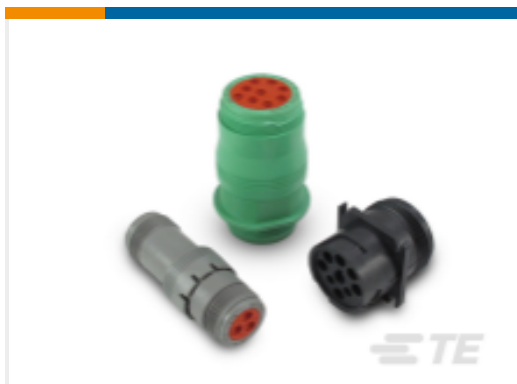
TE 产品编号HD14-3-16P DEUTSCH HD10 壳体