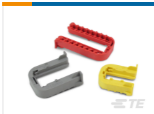
TE 产品编号1670720-2 重载连接器固定滑块