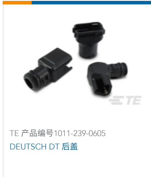
TE 产品编号1011-239-0605 DEUTSCH DT 后盖