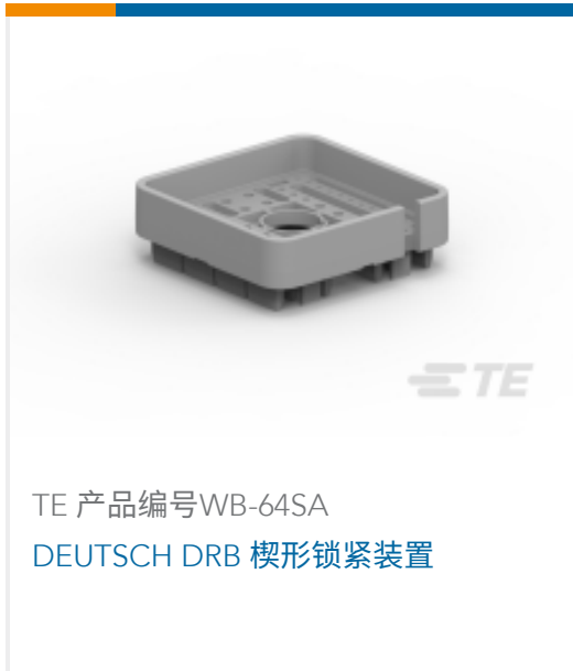
TE 产品编号WB-64SA DEUTSCH DRB 楔形锁紧装置