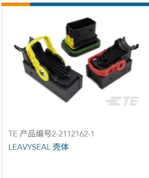
TE 产品编号2-2112162-1 LEAVYSEAL 壳体