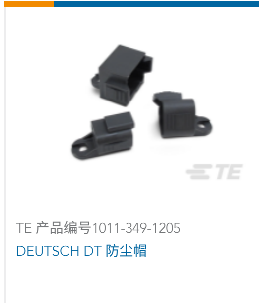
TE 产品编号1011-349-1205 DEUTSCH DT 防尘帽