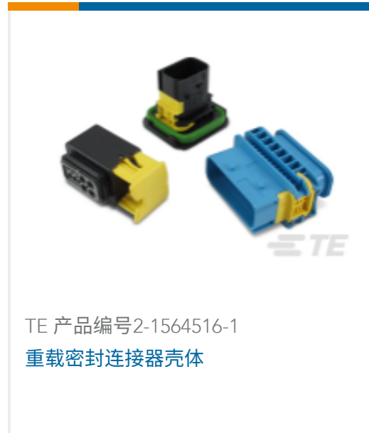
TE 产品编号2-1564516-1 重载密封连接器壳体