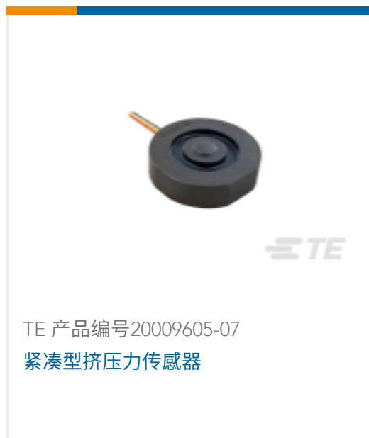
TE 产品编号20009605-07 紧凑型挤压力传感器