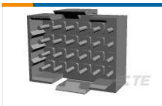
TE 产品编号1-206763-2 METRIMATE PIN HEADER ASSY,24P