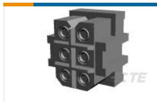
TE 产品编号1-207524-0 SKT HDR ASSY,6P,MMATE LF