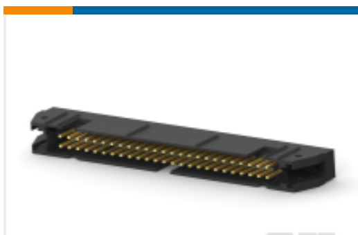
TE 产品编号1-499786-0 AMP 锁门通用插头