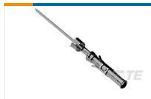
TE 产品编号1-66473-8 SKT,.062 DIA,.045 SQ POST,LP