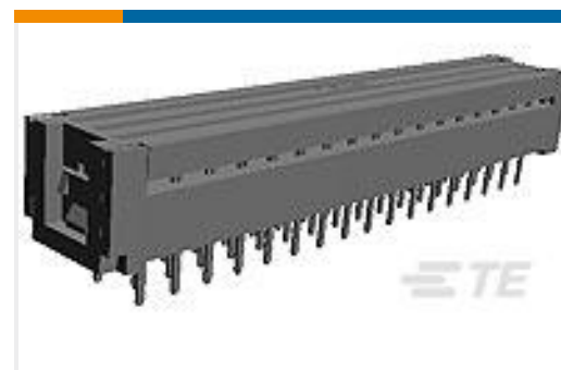
TE 产品编号1-5111595-5 080 ASSY SYS 50 PADDLEBOARD