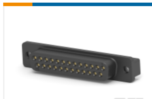
TE 产品编号1-5745967-5 D-Sub Receptacle Assembly: Vertical, Shell Size 3, 2.77mm