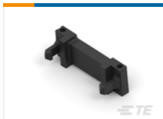
TE 产品编号111547-5 插针连接器：应力消除，通用