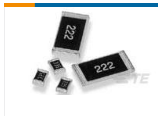
TE 产品编号1622838-1 CRG0603 1% 12K