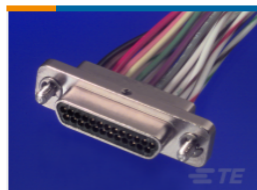
TE 产品编号1-1532179-2 M83513/03-A16N, MCKS-N1-B-9P6Q9- 72.0