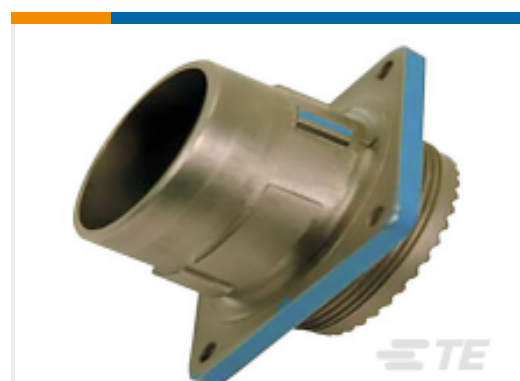
TE 产品编号YDIV46E25-19SNC128 PLUG ASSY