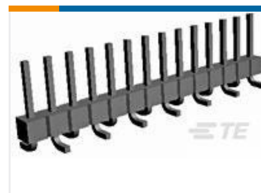
TE 产品编号146128-4 06 MODII HDR SR SFMNT B/A .100