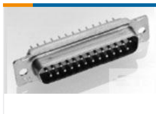
TE 产品编号1757510-2 AMPLIMITE, 15 POS PLUG