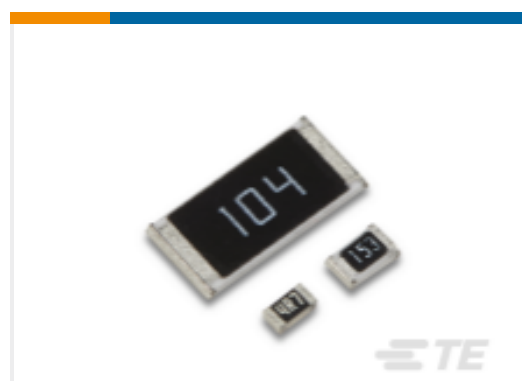
TE 产品编号1-2176341-5 CRGCO 0805 150R 1%