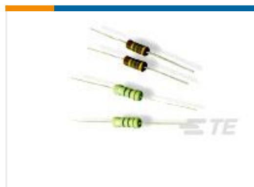
TE 产品编号1623720-4 CCR2 1K0 10%