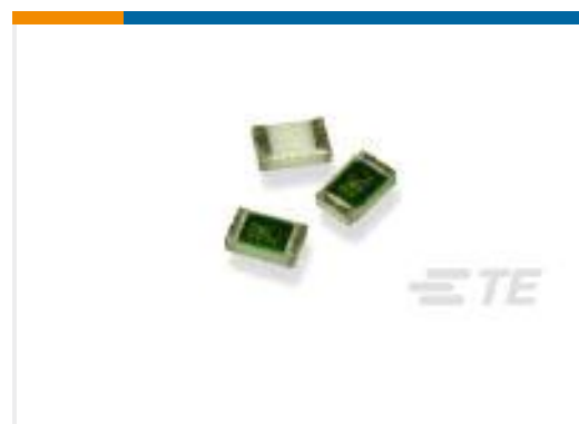
TE 产品编号1614884-9 CPF 0805 4R7 0.1% 25PPM 1K RL