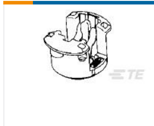
TE 产品编号1473369-1 SQUIB 11DIA SCR ASSY 8.8MM TYP