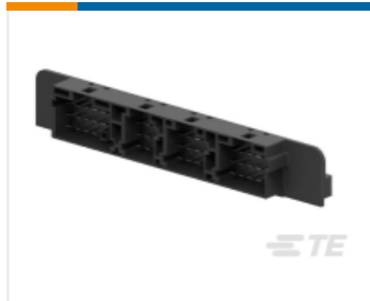
TE 产品编号1376430-5 高插针数接头