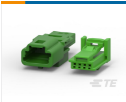
TE 产品编号1318756-2 TH/025 连接器系统, 壳体