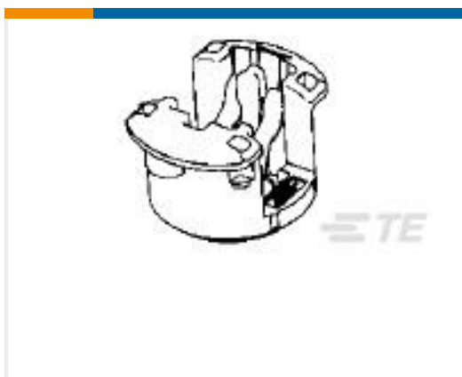
TE 产品编号1473369-3 SQUIB 11DIA SCR ASSY 8.8MM TYP