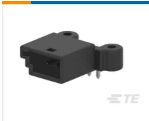
TE 产品编号1-1318772-3 信号接头