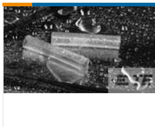
TE 产品编号CY1947-000 ES1000-NO.4-B7-X-55MM