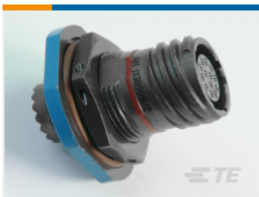
TE 产品编号 CAT-D38999-DTS17F Jam Nut: D38999, 17-35 Insert, Black Zinc Nickel Plating