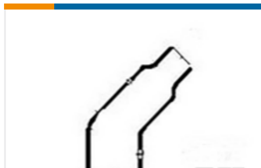
TE 产品编号 642427-000 热缩护套：聚合物成型，有嘴