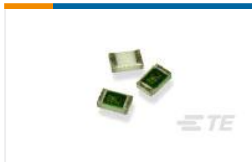
TE 产品编号 2-1614894-3 CPF 0805 301K 0.1% 25PPM 1K RL