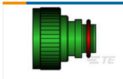
TE 产品编号 661269-000 TXR21AB00-1605AI