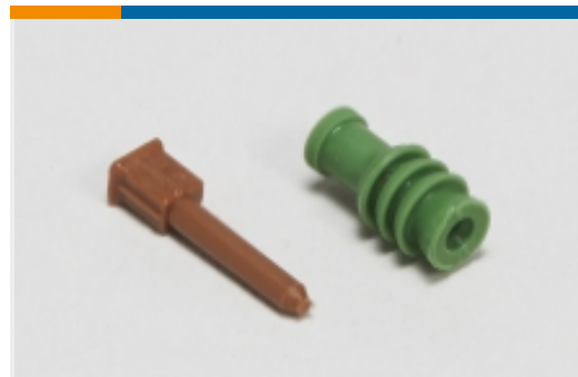
汽车密封件和盲堵(10)