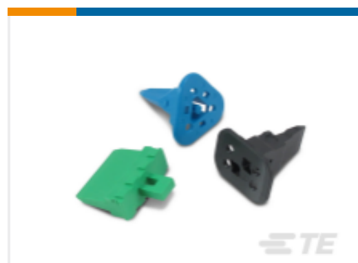
TE 产品编号W8S DEUTSCH DT 楔形锁紧装置