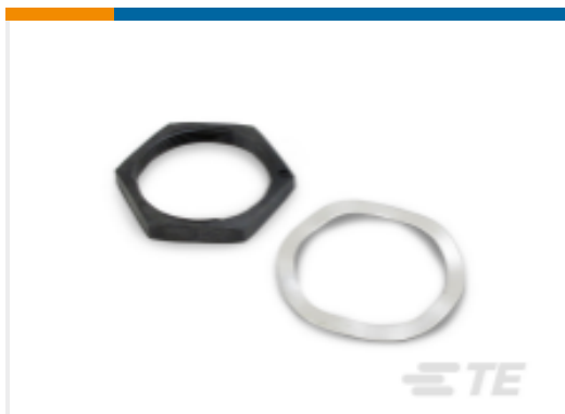
TE 产品编号2411-002-1805 DEUTSCH HDP20 安装硬件