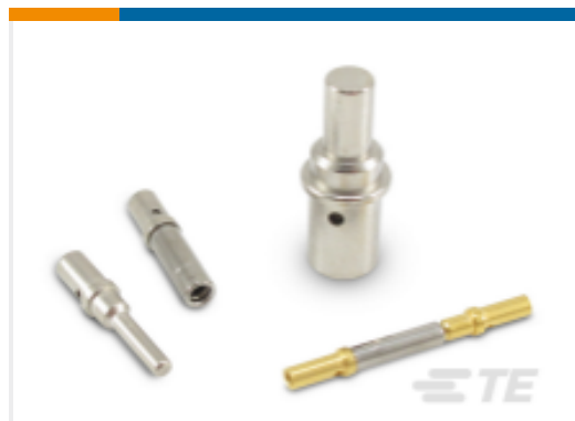
TE 产品编号0462-203-08141 DEUTSCH 实芯端子