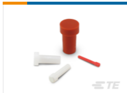
TE 产品编号114017-ZZ DEUTSCH 密封盲堵