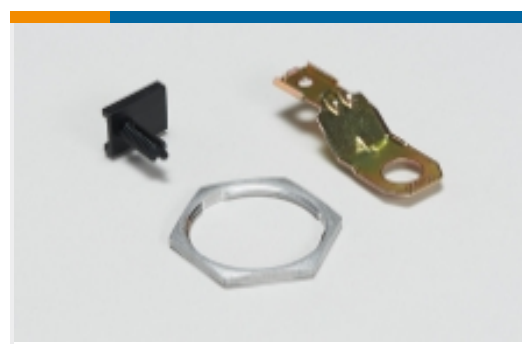
其他汽车连接器附件(14)