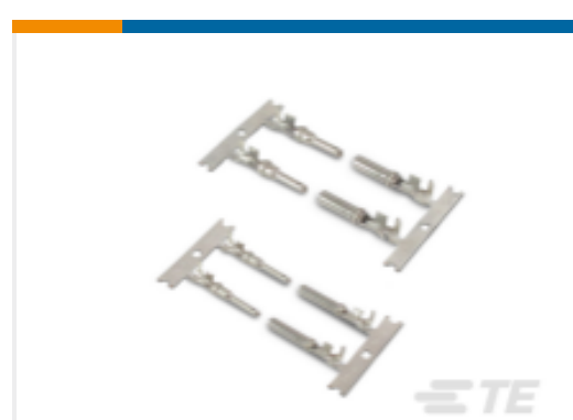
TE 产品编号1062-16-0122 DEUTSCH 冲压成型端子