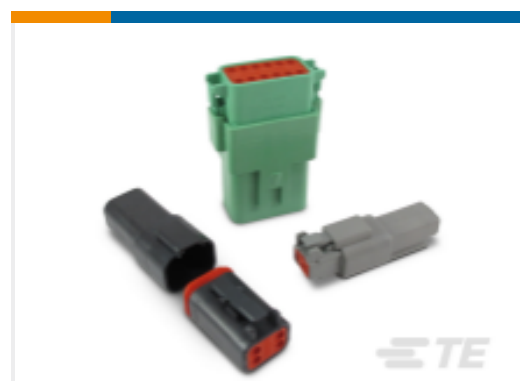
TE 产品编号DT04-08PA 德驰 DT 系列塑壳和连接器