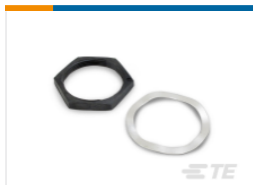
TE 产品编号2411-002-1805 DEUTSCH HDP20 安装硬件