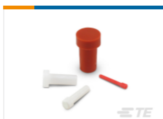
TE 产品编号0413-204-2005 DEUTSCH 密封盲堵