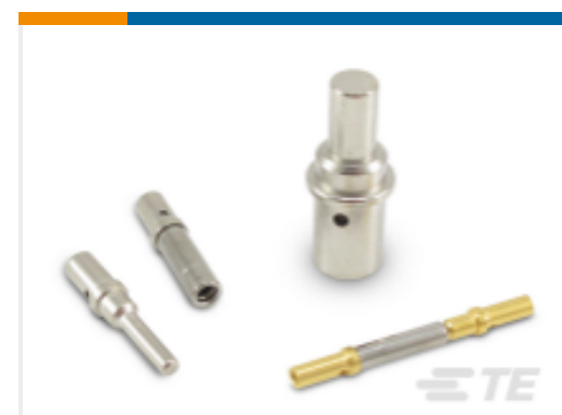
TE 产品编号0460-204-12141 DEUTSCH 实芯端子