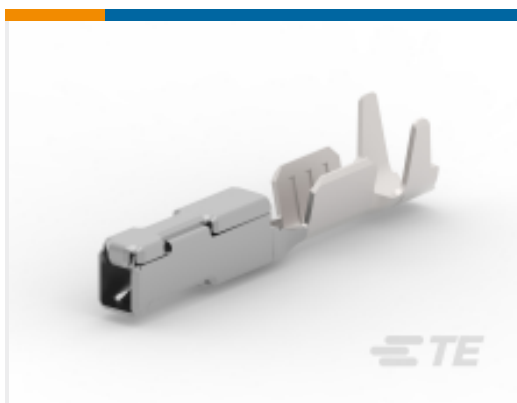
TE 产品编号1456968-8 CONTACT,FEMALE, 0.64, 0.35SQMM, AG, DIR