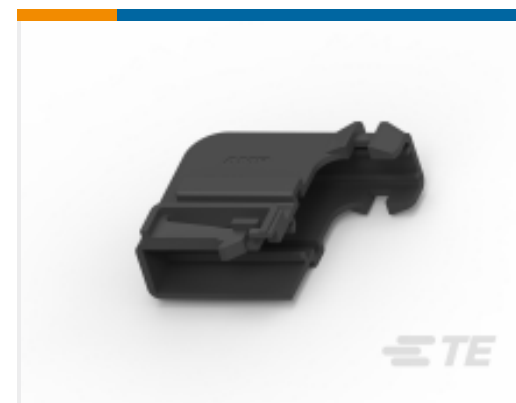
TE 产品编号1379788-1 8W + 2S MQS TAB HSG COVER