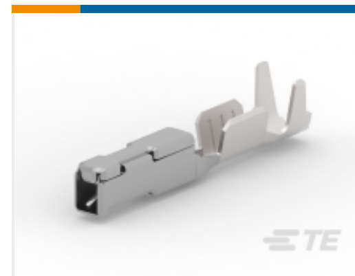
TE 产品编号1456968-6 CONTACT,FEMALE, 0.64, 0.35SQMM, AG