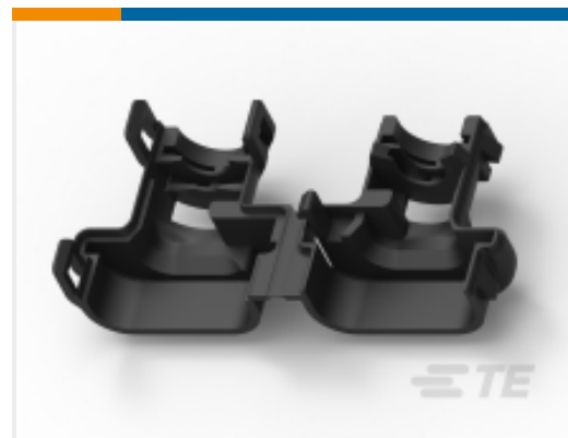
TE 产品编号1-1801168-5 COVER FOR 3W HP CONNECTOR