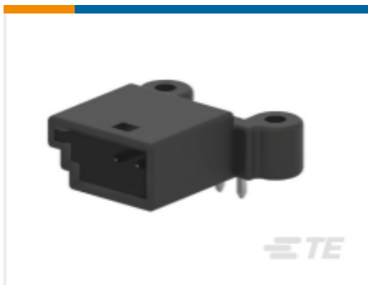
TE 产品编号2-1418637-5 信号接头