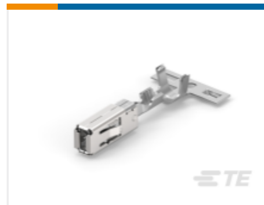
TE 产品编号1-2141859-1 AMP MCP 2.8, CONTACT