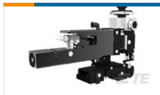
TE 产品编号2151279-2 OCEAN_2.0_APPLICATION-S-080F1000