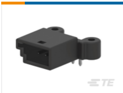
TE 产品编号1-967162-3 信号接头