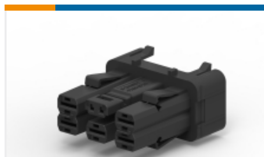
TE 产品编号2141615-1 5POS,AMP MCP6.3/4.8K,REC HSG