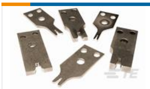
TE 产品编号2-1633710-2 CRIMPER, INSULATION O .062