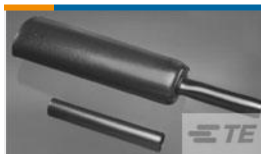
TE 产品编号F43323-000 RMW-16/5-1200/U-0