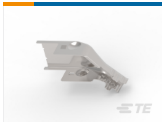
TE 产品编号1564609-1 SHIELD.SHELL,45,HALF2