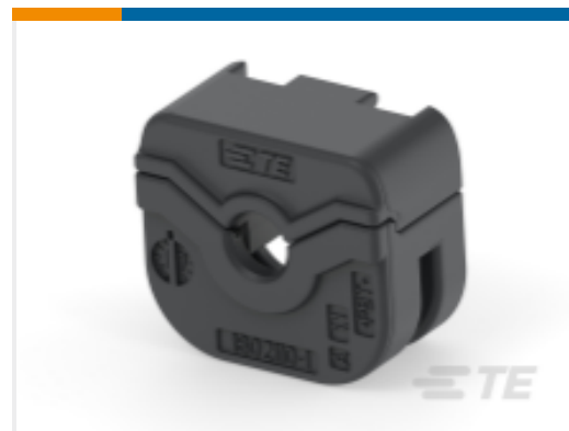
TE 产品编号1802110-1 COVER,MATENET SEALED PROTECTION, UTP