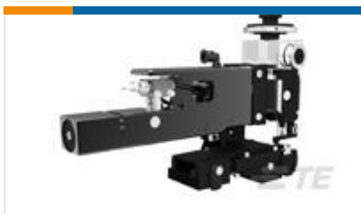
TE 产品编号2151997-2 OCEAN-2.0-APPLICATOR-S-090F130FA