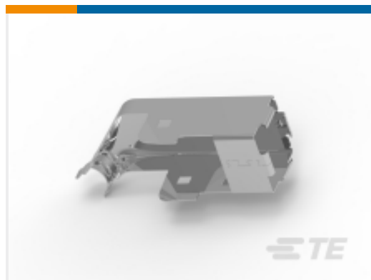
TE 产品编号1564608-1 SHIELD.SHELL,45,HALF1