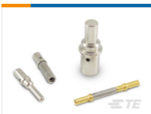
TE 产品编号0462-201-20141 DEUTSCH 实芯端子