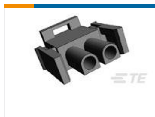
TE 产品编号1-480698-0 02P UMNL PLUG HSG NATL