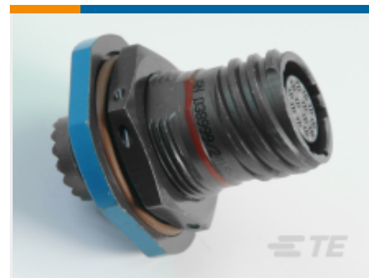
TE 产品编号 CAT-D38999-DTS16U Jam Nut: D38999, 13-35 Insert, Black Zinc Nickel Plating