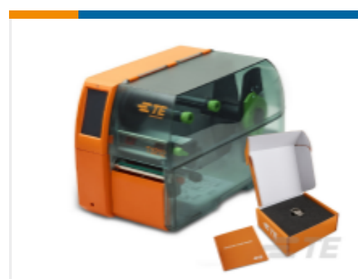
TE 产品编号 1-2186501-1 T3212-SWARE-PRINTER