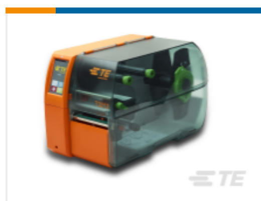
TE 产品编号 1-2186500-1 T3212-PRINTER