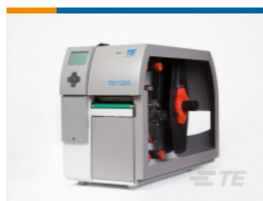
TE 产品编号 CP8122-000 T6112DS-PRINTER