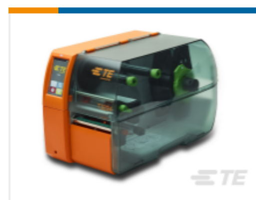
TE 产品编号 1-2186502-1 T3224-PRINTER