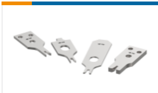
TE 产品编号1803191-3 CRIMPER, WIRE F, ANGLED LEADIN