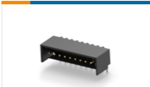
TE 产品编号2-644803-9 Polyester Right Angle PCB Header: 2.54mm, Shrouded, With Mating Alignment