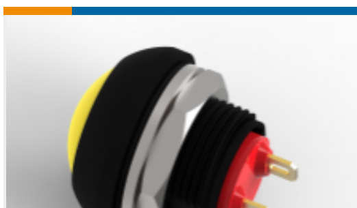
TE 产品编号2-2329360-3 PB ON/OFF RC YLW M1 TERM IP70