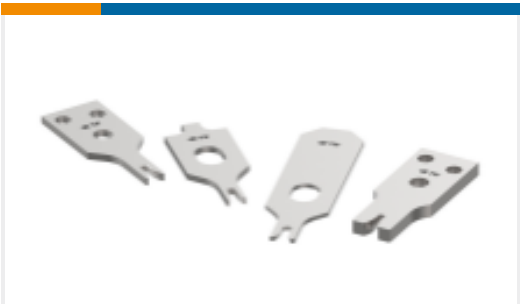
TE 产品编号1803167-4 CRIMPER, INSULATION F SPECIAL