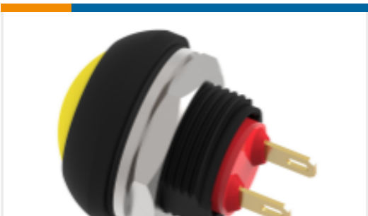
TE 产品编号2329360-8 PB OFF/ON RC YLW M2 TERM. IP68