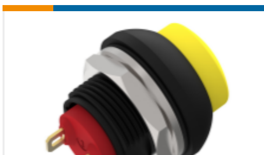
TE 产品编号2-2329328-3 PB ON/OFF HC YLW M1 TERM IP68