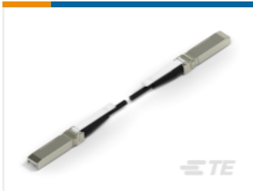
TE 产品编号2127933-1 26 AWG SFP+ 对 SFP+ I/O 电缆组件