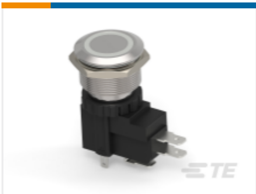
TE 产品编号2-2364686-8 AVH22 FLT SS LK RNG R&B 24V16A