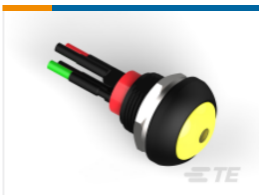
TE 产品编号1-2329389-1 PB OFF/ON FC YLW M1 TERM WHI LED IP68 50