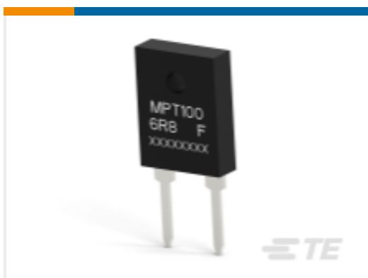
TE 产品编号2176429-5 MPT100 R47 5%