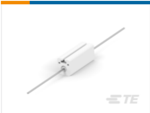
TE 产品编号1623723-2 线绕电阻器：轴向安装，17 瓦特