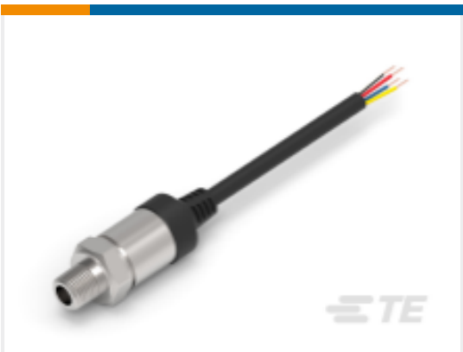
TE 产品编号20004013-00 PRESS XDCR M325P-00000E-025BG