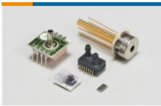
板装式压力传感器(15)