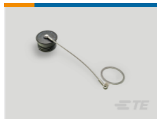
TE 产品编号YDTS32W23NV0010000 DUST COVER ASSEM