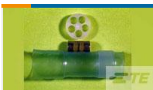
TE 产品编号650025-000 D-436-29