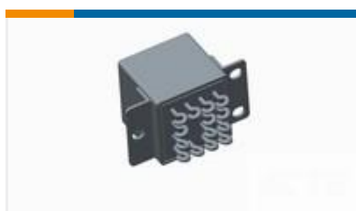
TE 产品编号1617806-3 TD228-5000S=TDFO .5 SEC