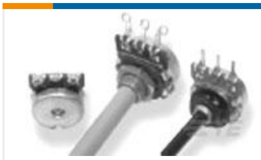
TE 产品编号1623767-2 23E 1MA 6.35X50FL B7 CAT