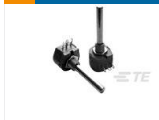
TE 产品编号1676979-4 TW 1W 10K 6.35X25PL