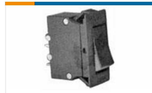
TE 产品编号3-1423673-9 W51-A152A1-5=CKTBKR,THERM,ROC