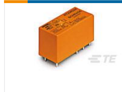
TE 产品编号9-1393239-1 RT314005