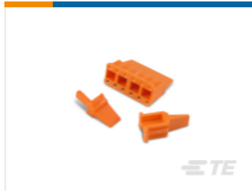
TE 产品编号WM-12S DEUTSCH DTM 楔形锁紧装置