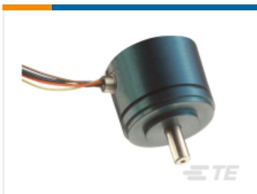
TE 产品编号02560231-000 RVDT R30A ASSY