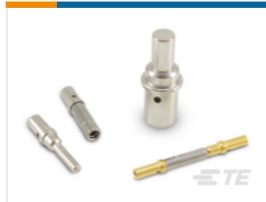
TE 产品编号0462-005-20141 DEUTSCH 实芯端子