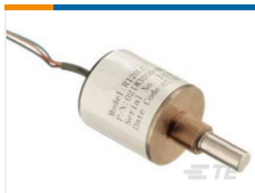
TE 产品编号66530072-000 R-FLEX CPLG ADP RVIT/RVDT/RSYN