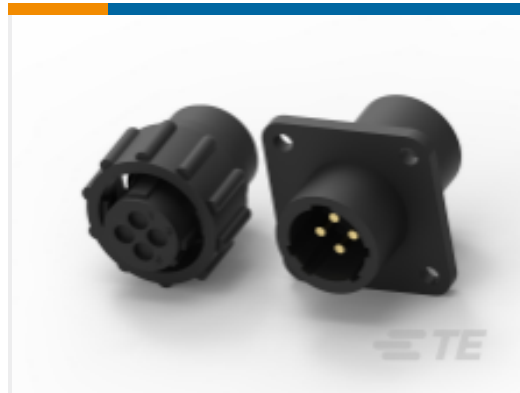
TE 产品编号211400-1 CPC 系列 1