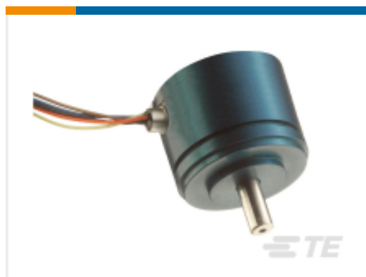
TE 产品编号02560231-140 R30A 10KHZ +/-40 DEGREES