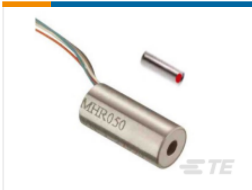
TE 产品编号02560408-000 小型轻量 LVDT