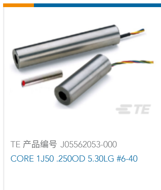
TE 产品编号 J05562053-000 CORE 1J50 .250OD 5.30LG #6-40