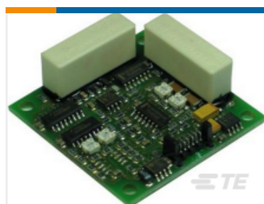
TE 产品编号 G-NSMIS-014 CONNECT. MOLEX 6POL 20CM CABLE