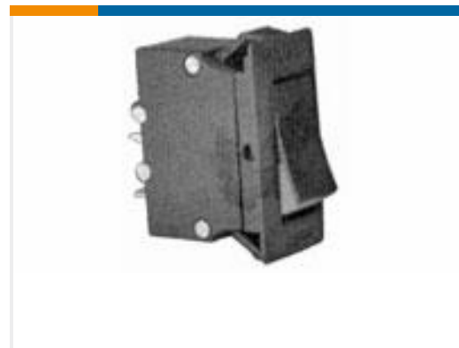
TE 产品编号3-1423673-9 W51-A152A1-5=CKTBKR,THERM,ROC