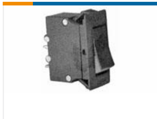
TE 产品编号4-1423673-0 W51-A152A1-10=CKTBKR,THERM,ROC