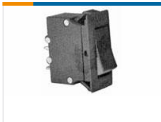
TE 产品编号1-1423673-6 W51-A151A1-7=CKTBKR,THERM,ROC