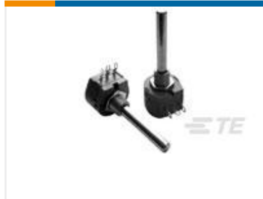
TE 产品编号1676979-4 TW 1W 10K 6.35X25PL