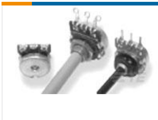
TE 产品编号1623767-2 23E 1MA 6.35X50FL B7 CAT