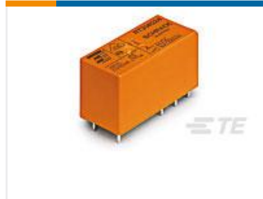
TE 产品编号9-1393239-1 RT314005