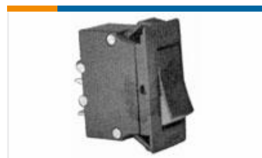
TE 产品编号1-1423673-6 W51-A151A1-7=CKTBKR,THERM, ROCK