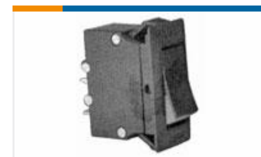
TE 产品编号3-1423673-9 W51-A152A1-5=CKTBKR,THERM,ROC