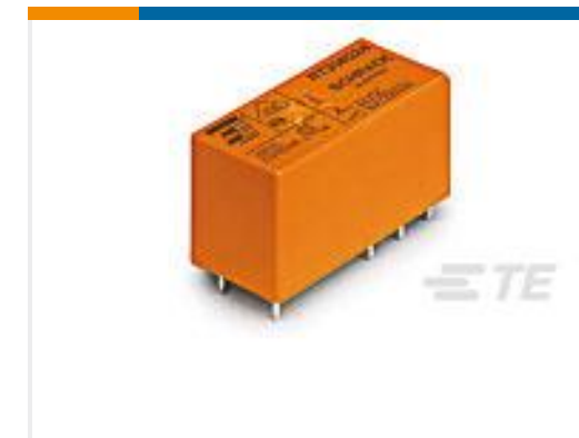
TE 产品编号9-1393239-1 RT314005