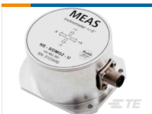
TE 产品编号G-NSMIS-008 CABLE 2M CONNE D 79-3480-32-08