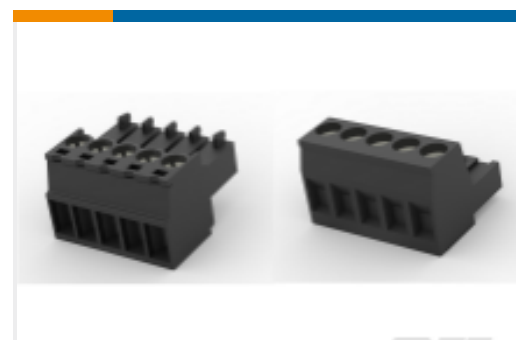
TE 产品编号2213934-2 表面贴装 TB 母端