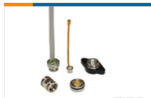
TE 产品编号154N-005G-RT 介质隔离式压力传感器库存列表