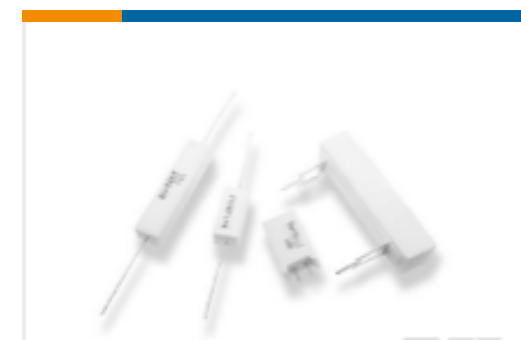
TE 产品编号1623804-8 线绕电阻器：水平安装