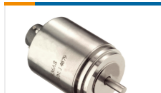
TE 产品编号04290595-000 CABLE ASSY GCA/HCA TO LDM-1000