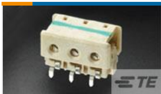
TE 产品编号2106751-3 Connector, Thru Hole-IDC, 3 pos, 18AWG