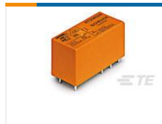
TE 产品编号9-1393239-1 RT314005