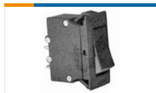
TE 产品编号1-1423673-6 W51-A151A1-7=CKTBKR,THERM, ROCK