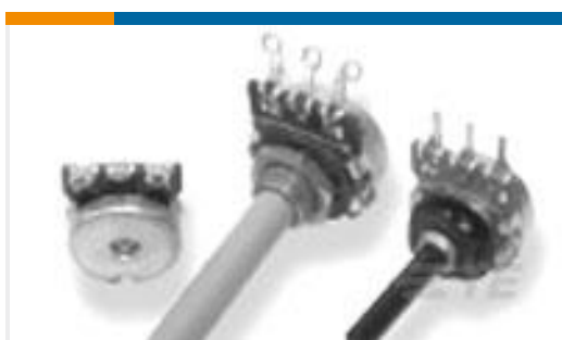
TE 产品编号1623767-2 23E 1MA 6.35X50FL B7 CAT