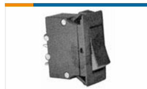
TE 产品编号3-1423673-9 W51-A152A1-5=CKTBKR,THERM,ROC