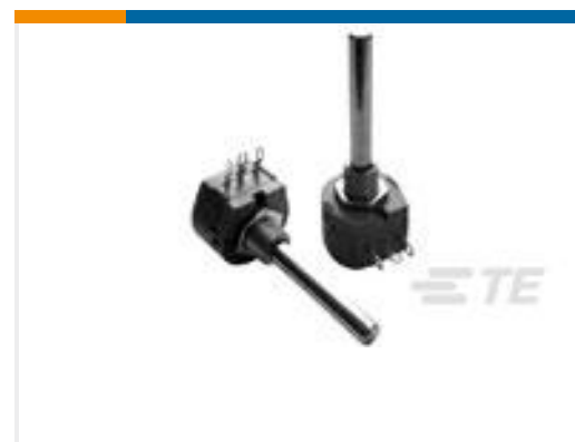
TE 产品编号1676979-4 TW 1W 10K 6.35X25PL