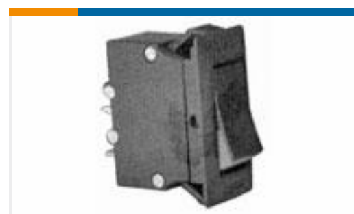
TE 产品编号4-1423673-0 W51-A152A1-10=CKTBKR,THERM, ROC