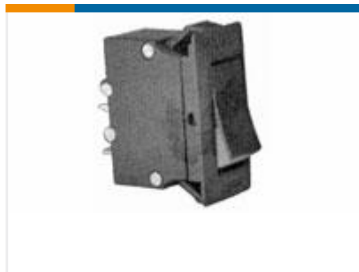
TE 产品编号1-1423673-6 W51-A151A1-7=CKTBKR,THERM, ROCK