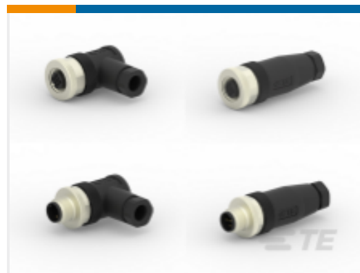
TE 产品编号T4110001051-000 M12 可现场安装非屏蔽式