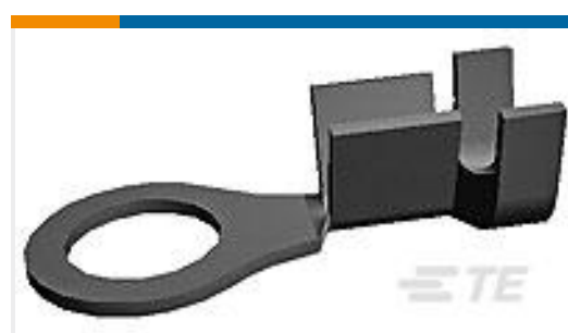
TE 产品编号140526 RT 5.2MM DIA TERMINAL 20-16 AWG TPBR