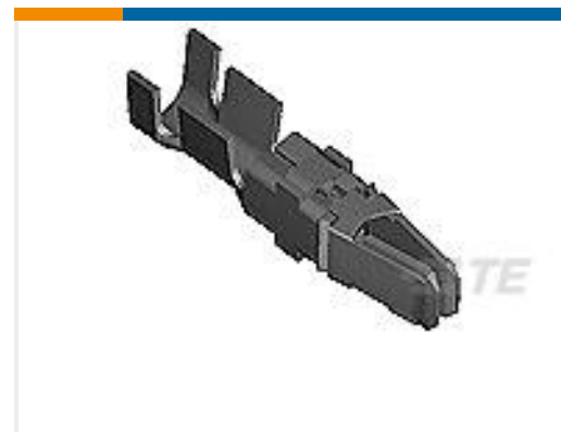
TE 产品编号1-66740-1 TYPE XII FEMALE CONT (STRIP)