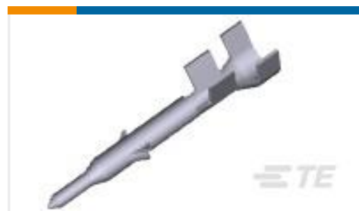
TE 产品编号1-794406-0 MINI UMNL SOK 20-16 AWG AU LF