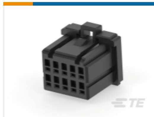
TE 产品编号1-1827862-5 Dynamic 1100 母端和公端壳体