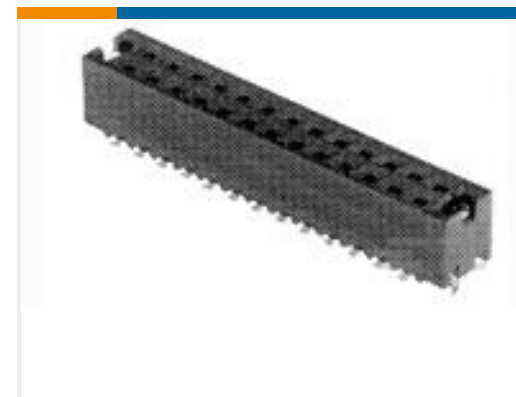
TE 产品编号1241893-6 2X6P HV100 REC. CON, SMD, TIN, BLIST, BE