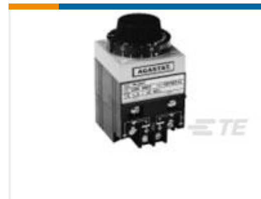
TE 产品编号2-1423159-2 7012PBX=RLY,STD,ON,2P,125VDC, 16PDT