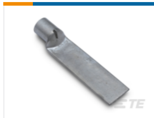
TE 产品编号2-326111-1 AMPPOWER 端子无螺钉孔