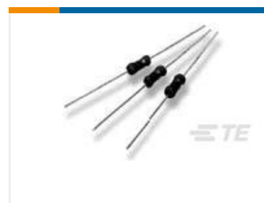
TE 产品编号3-1879351-7 RR01 5% 91K AMMO