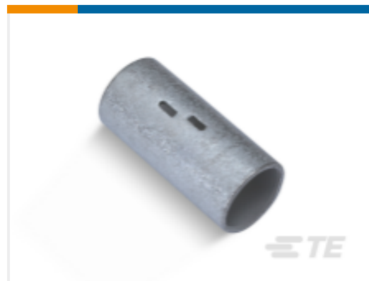
TE 产品编号324458 AMPPOWER 对接接头