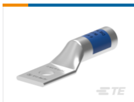
TE 产品编号EN3750-799 TCTS-500-1/2-U