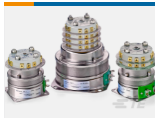
TE 产品编号1755066-1 MDR-7025=RLY,LTH,MED,28VDC, 16PDT