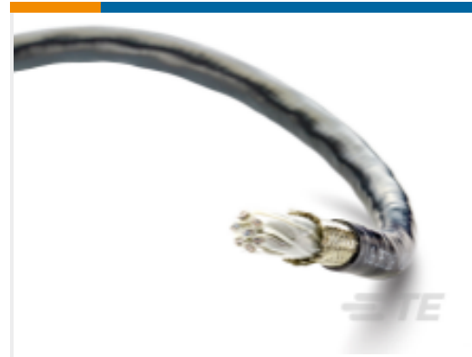
TE 产品编号CD48003001 VG-95218-T021-C107