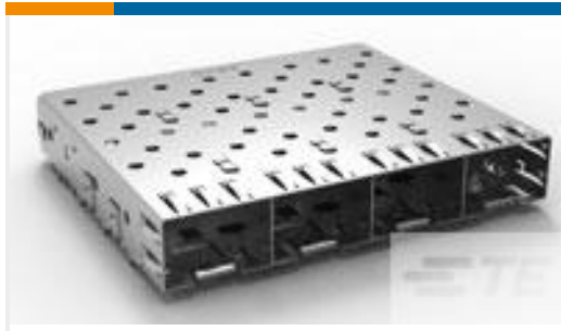
TE 产品编号2170285-1 SFP CAGE&PT ASSY PRESS FIT 1X4