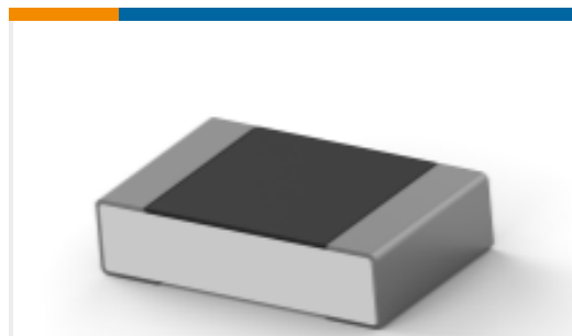
TE 产品编号9-2176374-8 RQ 0805 1K1 0.1% 10PPM 1K RL