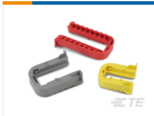
TE 产品编号1564411-2 重载连接器固定滑块