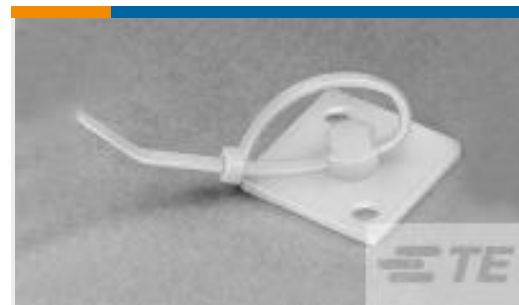
TE 产品编号 607847-1 CABLE TIE MOUNT