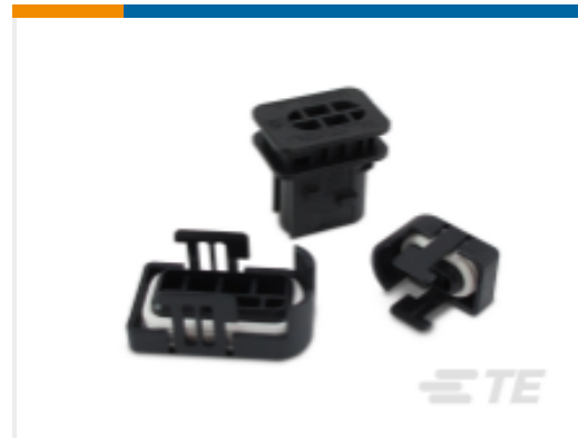
TE 产品编号2112291-1 重载连接器保护帽