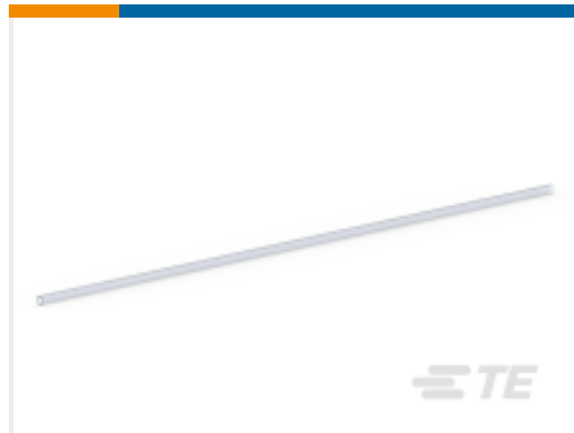
TE 产品编号5575754001 单壁 CGPT 卷轴热缩管