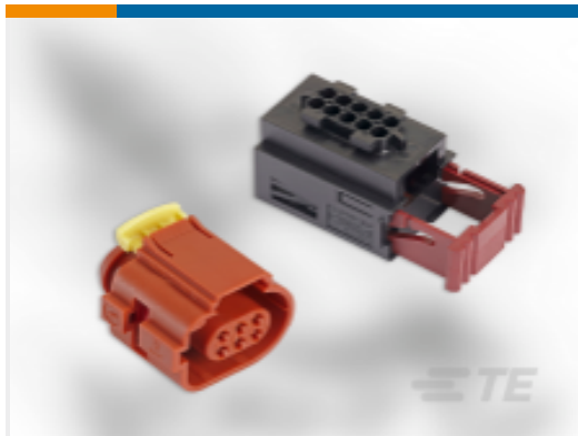
TE 产品编号282189-7 定时器，连接器壳体