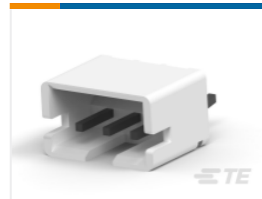
TE 产品编号6-440054-5 AMP HPI 2.0MM 接头