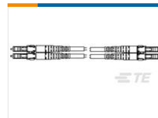
TE 产品编号5-2061348-0 FOSM LEAD LC/DPX ODVA - LC/DPX 50M