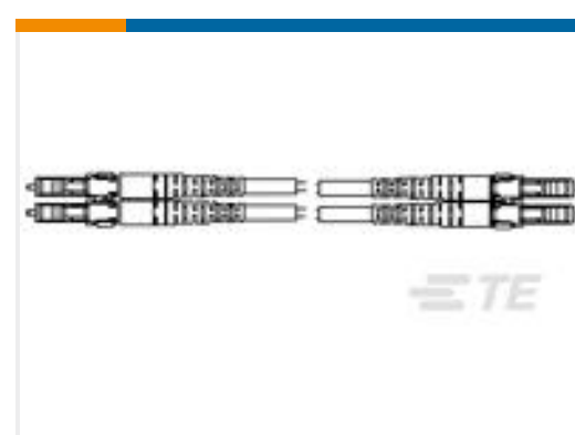
TE 产品编号8-2061348-1 FOSM LEAD LC/DPX ODVA - LC/DPX 120M