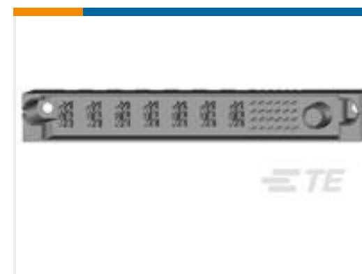
TE 产品编号1932045-1 MBXL VERT HDR 7ACP+24S+1RF