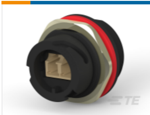
TE 产品编号 1828619-1 Kit, Receptacle, LC, ODVA, MM