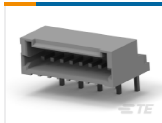
TE 产品编号5-292227-3 MINI 通用终端接头