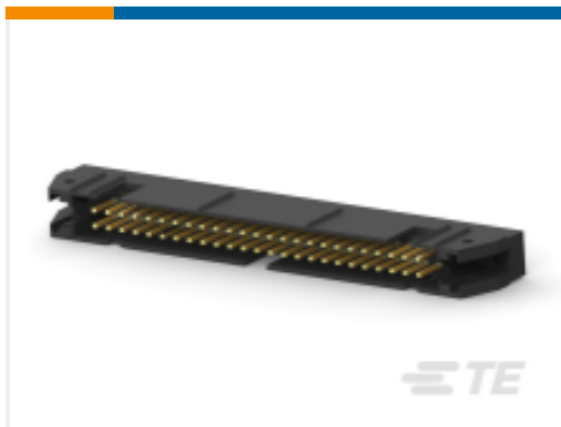
TE 产品编号2-5102321-4 AMP 锁门通用插头