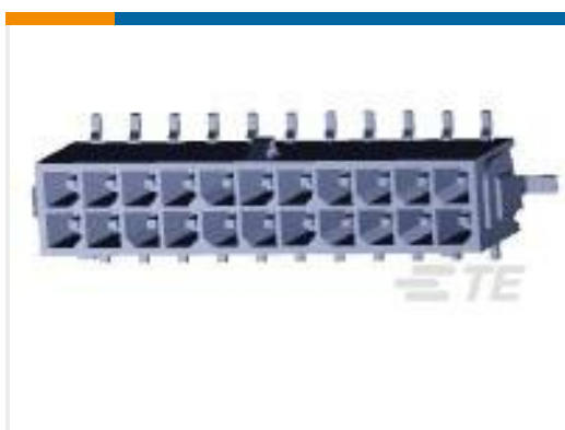
TE 产品编号5-794638-2 22P MICRO MNL ASSY, VRT, SMT, LF