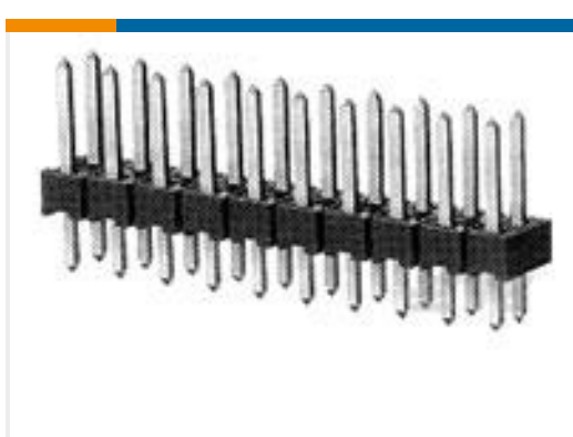
TE 产品编号6-146252-7 34 MODII HDR DRST B/A .100 LF