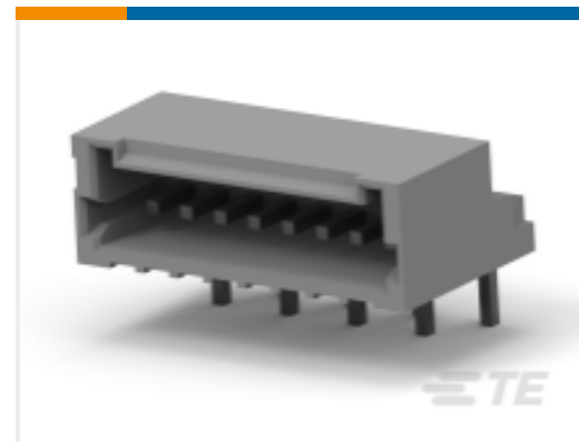
TE 产品编号 5-292227-3 MINI 通用终端接头