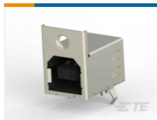
TE 产品编号 1734091-1 STD USB TYPE B, R/A, T/H, (WITH SHIELD)