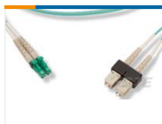
TE 产品编号 9-1920985-9 FOMM62.5 LEAD LC/DPX ODVA - SC /DPX 100M