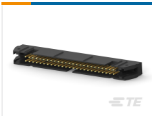
TE 产品编号 2-5102321-4 AMP 锁门通用插头