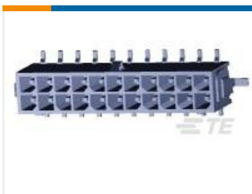
TE 产品编号 5-794638-2 22P MICRO MNL ASSY, VRT, SMT, LF