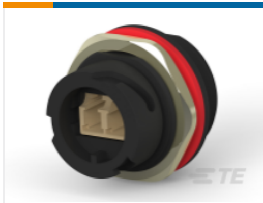
TE 产品编号 1828619-1 Kit, Receptacle, LC, ODVA, MM