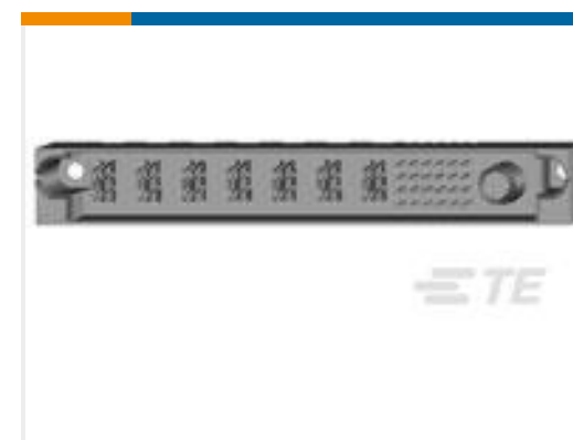
TE 产品编号 1932045-1 MBXL VERT HDR 7ACP+24S+1RF