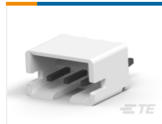
TE 产品编号 6-440054-5 AMP HPI 2.0MM 接头