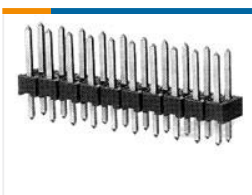
TE 产品编号 6-146252-7 34 MODII HDR DRST B/A .100 LF