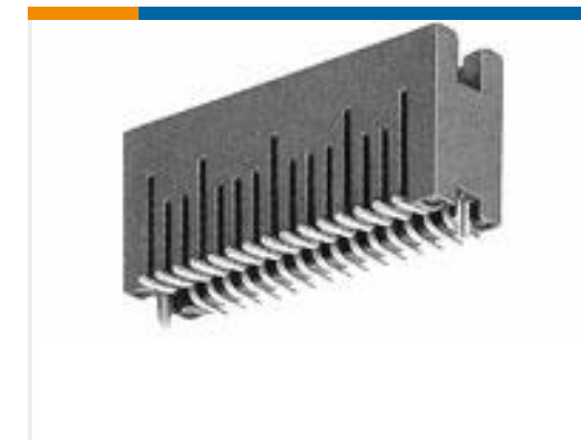
TE 产品编号 5-147383-2 20 50/50 HDR SMT.390 W/HD VC