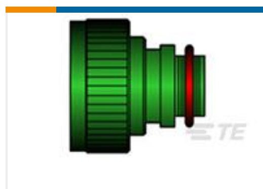
TE 产品编号 661269-000 TXR21AB00-1605AI