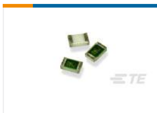
TE 产品编号 2-1614894-3 CPF 0805 301K 0.1% 25PPM 1K RL