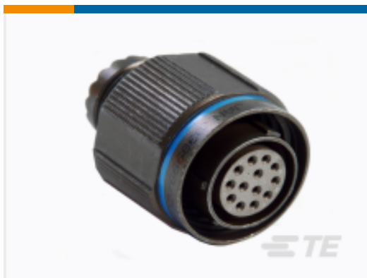
TE 产品编号 CAT-D38999-DTS18F Straight Plug: D38999, 09-98 Insert, Electroless Nickel Plating