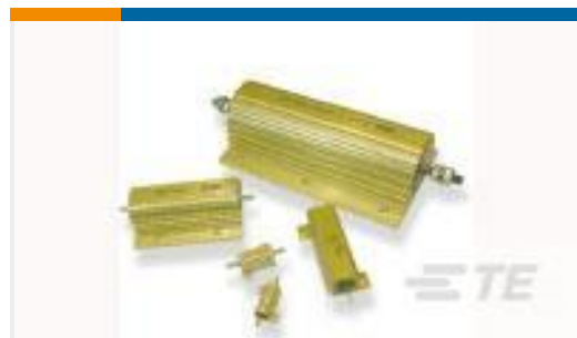
TE 产品编号5-1630186-7 HSA50 2K4 5%