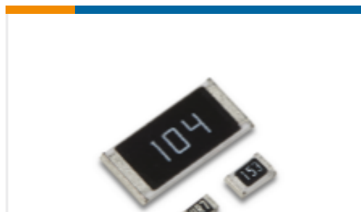
TE 产品编号3-2176348-9 CRGCQ 2010 2M2 5%