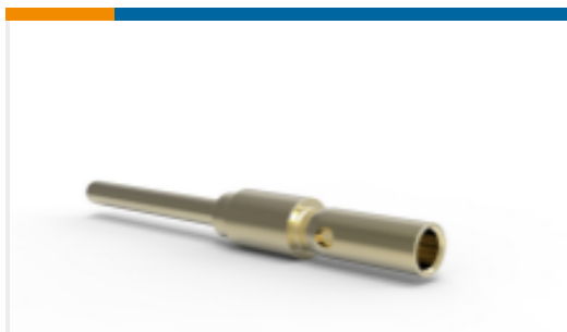
TE 产品编号1-2314102-1 M12 CRIMP CONTACT PIN 1 MM AU 0.8 AWG20