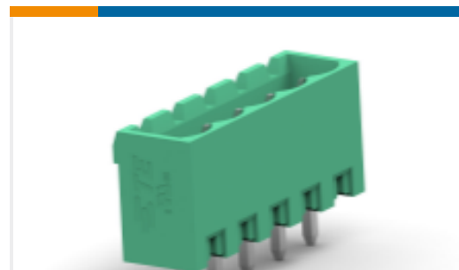
TE 产品编号2351885-2 2POS TB HDR 180 DEG, PITCH 5.0&TL 4.5mm