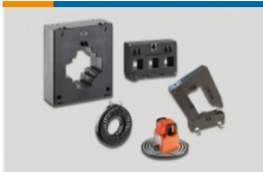
电流变压器和分流器(547)