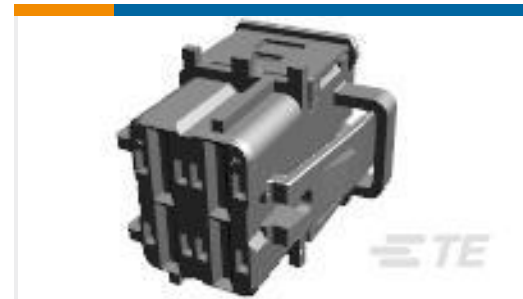
TE 产品编号1534404-2 MCP6.3 RECEP HSG4P