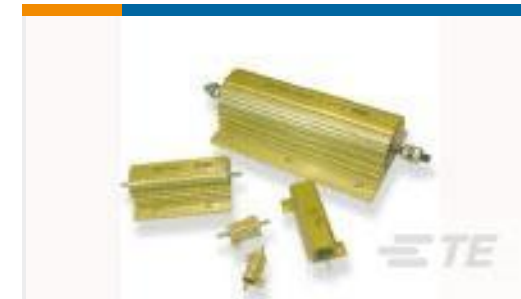
TE 产品编号2-1630024-5 HSC250 6R8 5%