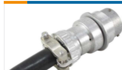
TE 产品编号HD34-18-14SE-059 REC,14P,AL,E,CBL CLMP BT, DRAIN, 16,S,MC