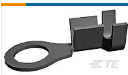
TE 产品编号160787-1 RING TONGUE IS 18-14 AWG .0840 X . 940 BR