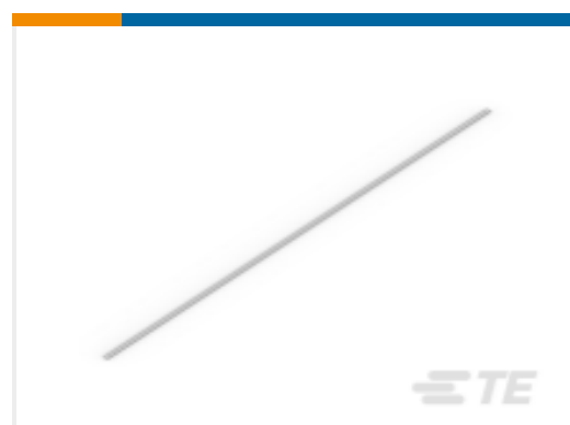
TE 产品编号1SNA163350R1500 PRH2R