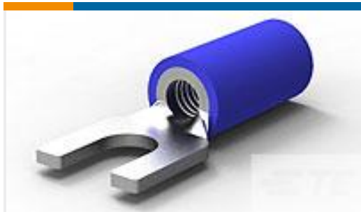
TE 产品编号 322994 TERMINAL,PG SPD 16-14 6