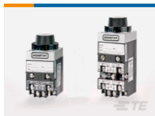
TE 产品编号6-1423159-4 7012X3C=RLY,STD,ON,2P,110VDC,1