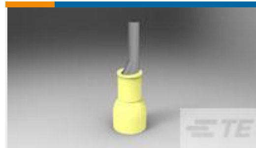
TE 产品编号165133 PIDG WIRE PIN