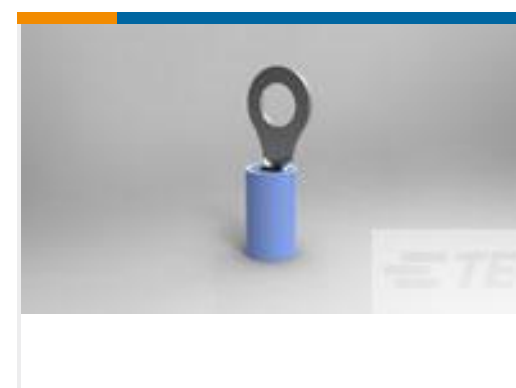
TE 产品编号7-1377173-4 SMP 0-0130094-0