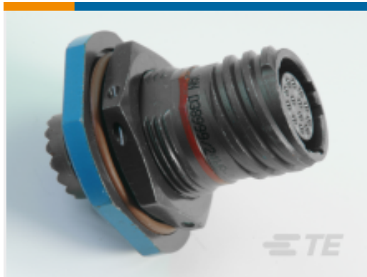
TE 产品编号YDTS24Z17-35PAV001 RECP ASSY