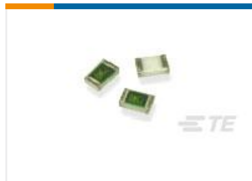
TE 产品编号1676164-2 RN 0805 11K8 0.1% 10PPM 1KRL