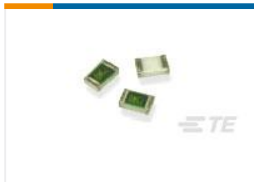
TE 产品编号1676156-2 RN 0805 113K 0.1% 10PPM 1KRL