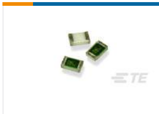
TE 产品编号3-1614883-3 CPF 0805 27R 0.1% 25PPM 5K RL