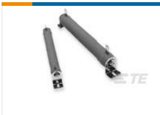
TE 产品编号1879455-1 TE 1500W 1R0 5% Bracket