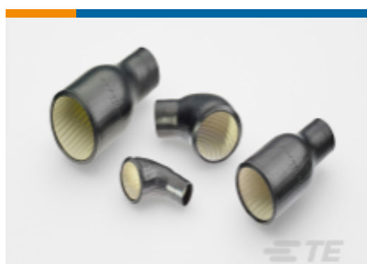
TE 产品编号EK7310-000 222S142-25C-0