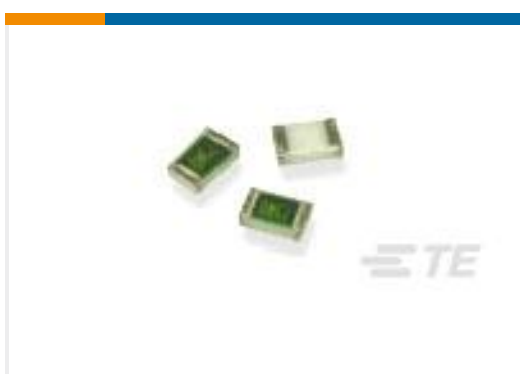
TE 产品编号1676216-2 RN 0805 19K1 0.1% 10PPM 1KRL