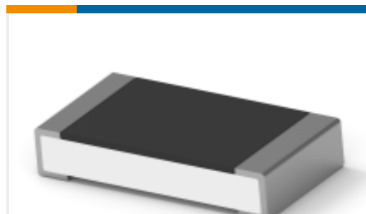
TE 产品编号1-2176391-4 RQ 1206 16K9 0.1% 10PPM 5K RL