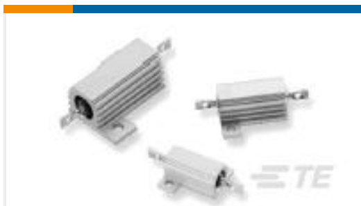
TE 产品编号1-1879073-6 THS10 3R3 5%