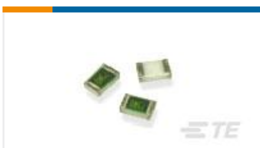
TE 产品编号1676458-2 RN 0805 8K66 0.1% 10PPM 1KRL