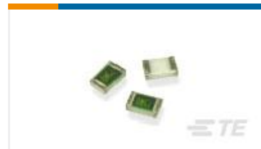
TE 产品编号1676229-2 RN 0805 1K33 0.1% 10PPM 1KRL