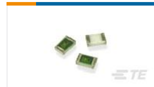
TE 产品编号1676451-2 RN 0805 86R6 0.1% 10PPM 1KRL