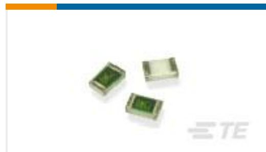
TE 产品编号1676157-2 RN 0805 113R 0.1% 10PPM 1KRL