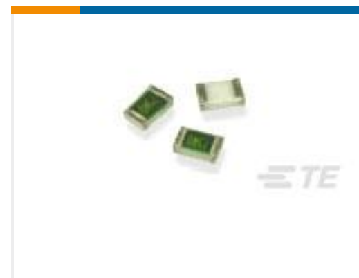
TE 产品编号6-1879127-7 RN 0402 422R 0.1% 10PPM CUT LENGTH