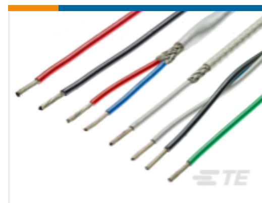
TE 产品编号CQ80093001 44A0211-8-45