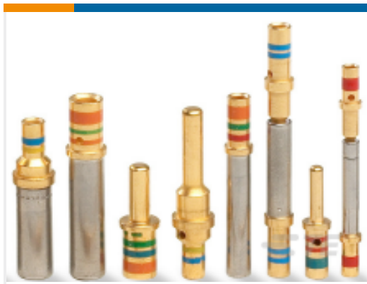
TE 产品编号 38943-22L CONT SOC ASSY