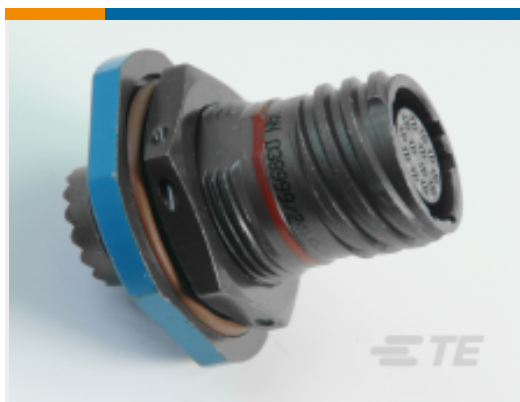
TE 产品编号YDTS24Z25-19PNV001 RECP ASSY