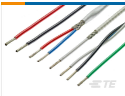
TE 产品编号2823013001 44A0211-8-9