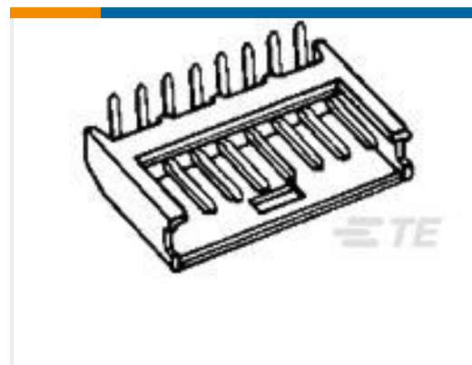
TE 产品编号280382-1 15P MODU II SHRD HDR, RT ANG, TIN