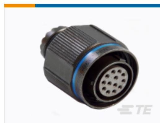
TE 产品编号YDTS26F23-21SCC001 PLUG ASSY