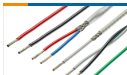
TE 产品编号3838143001 44A1121-24-2/3-9