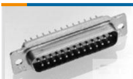
TE 产品编号1757829-5 AMPLIMITE,PLUG ASY,POSTD,109,ZN,5