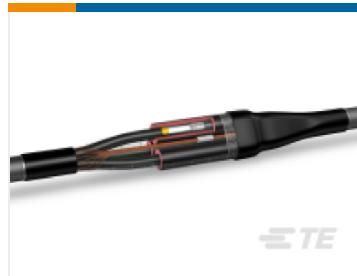
TE 产品编号D11309-070 POLJ-12/3X25-70