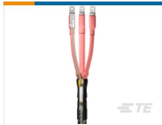
TE 产品编号C47372-064 GUST-12/25-50/800