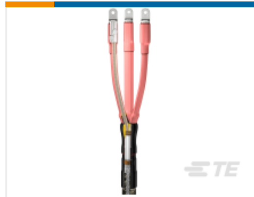
TE 产品编号A31452-070 GUST-12/70-120/800-L12