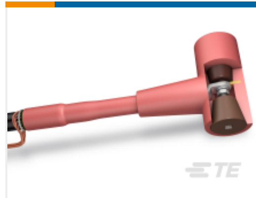
TE 产品编号555340-070 RICS-5123