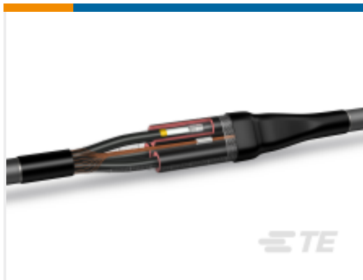
TE 产品编号A69078-064 POLJ-12/3X70-150