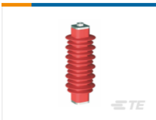
TE 产品编号EN6028-000 HDA-33M-B3-NFF