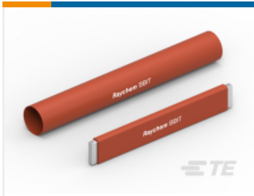
TE 产品编号560936-000 母线绝缘管高达 35 kV