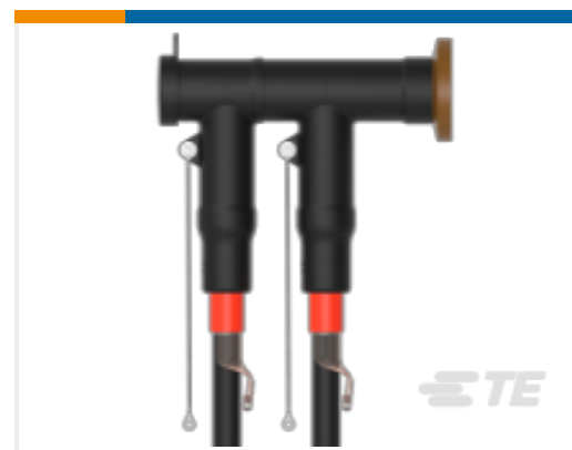
TE 产品编号CM0097-005 RSTI-CC-5854