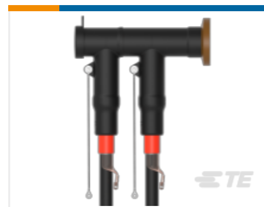
TE 产品编号CM0097-005 RSTI-CC-5854