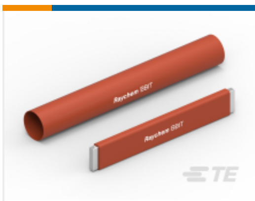
TE 产品编号560936-000 母线绝缘管高达 35 kV