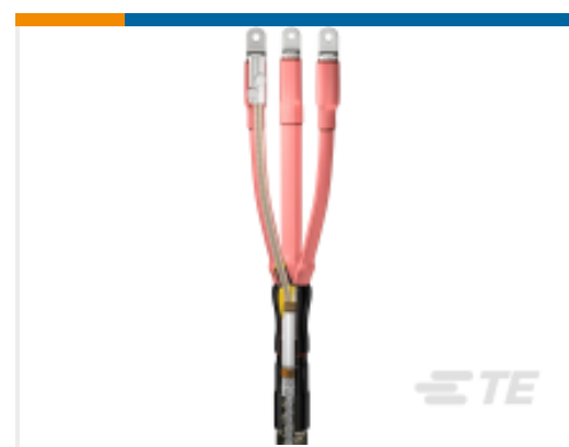
TE 产品编号C47372-064 GUST-12/25-50/800