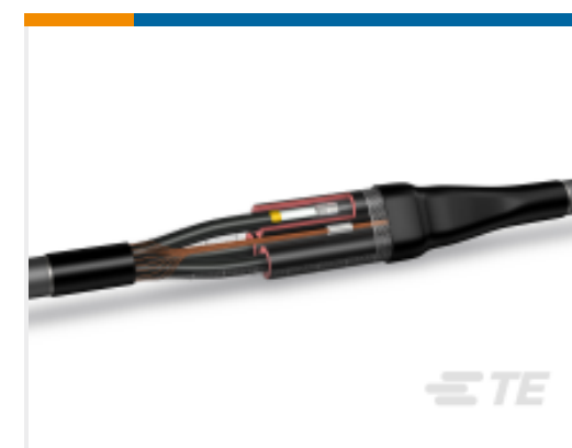
TE 产品编号D11309-070 POLJ-12/3X25-70