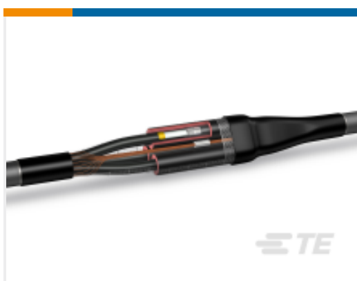
TE 产品编号A69078-064 POLJ-12/3X70-150