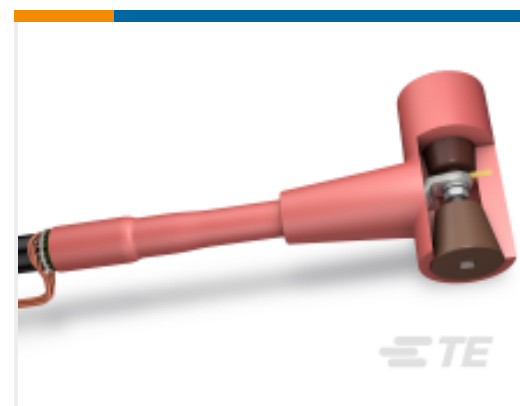
TE 产品编号555340-070 RICS-5123