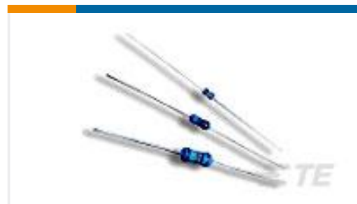
TE 产品编号1622296-1 LR1 1% 100K