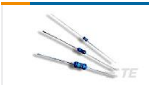
TE 产品编号1622297-1 LR1 1% 100R