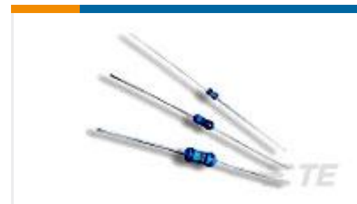
TE 产品编号1622302-1 LR1 1% 10R