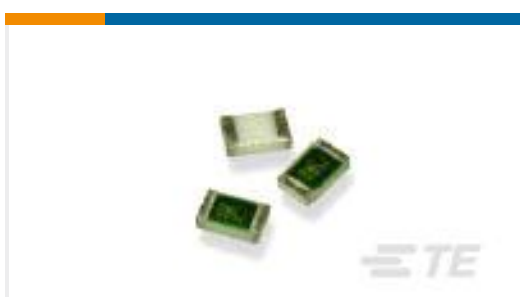
TE 产品编号1614902-2 CPF0805 1K0 0.1% 25PPM 5K RL