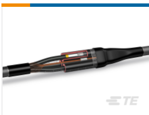
TE 产品编号A69078-064 POLJ-12/3X70-150