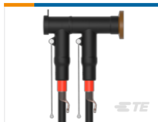
TE 产品编号CM0097-005 RSTI-CC-5854