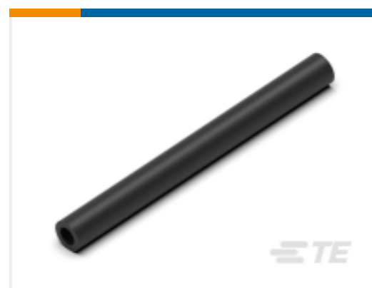
TE 产品编号CN5946-000 EN-CGAT-6/2-0-1200