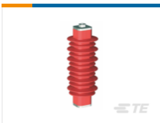
TE 产品编号EN6028-000 HDA-33M-B3-NFF