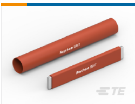
TE 产品编号560936-000 母线绝缘管高达 35 kV