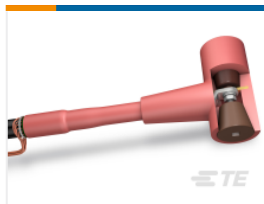
TE 产品编号555340-070 RICS-5123