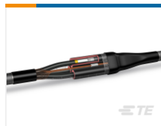
TE 产品编号D11309-070 POLJ-12/3X25-70